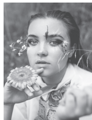
Mona Vetsch Moderation